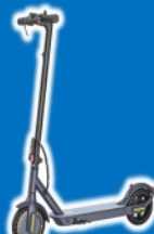
2 SCOOTER ELECTRICA